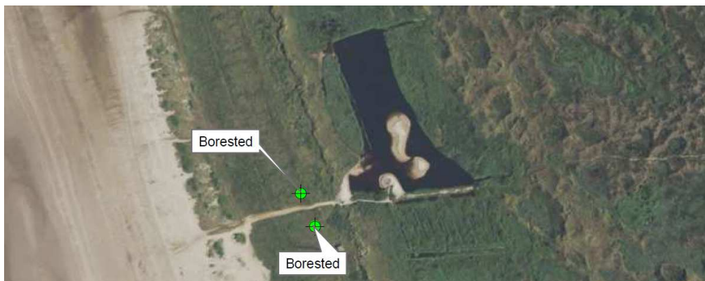
Figur 3. Kortet viser placering af projekterede indvindingsboringer på lokalitet 1, matr. nr. 308a Sønderho By, Sønderho. Skitse fra ansøgningsmaterialet.