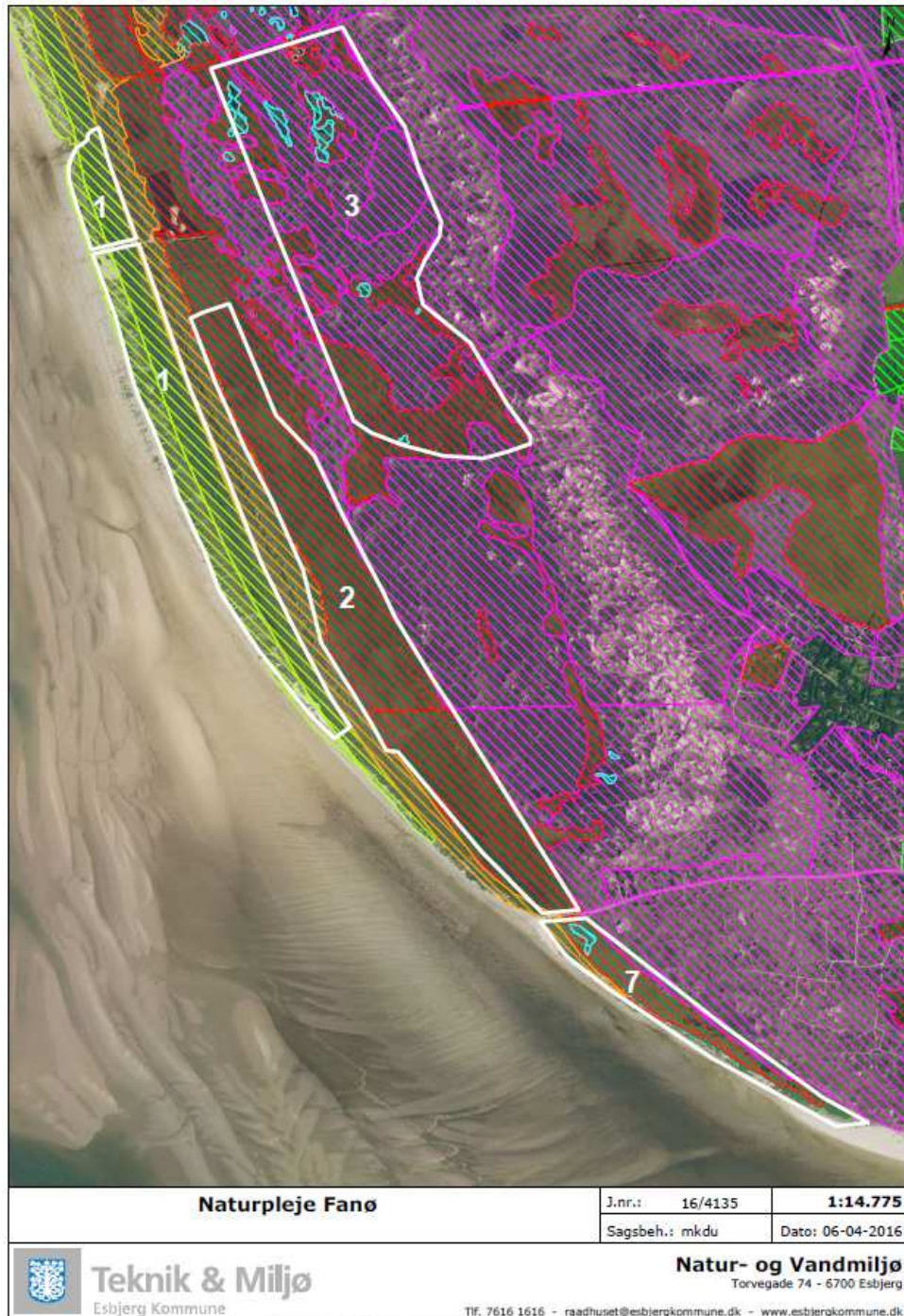
Figur 2. Kortet viser delområderne 1, 2, 3 og 7, hvor Esbjerg Kommune har meddelt tilladelse til naturpleje. Kortmaterialet er udleveret af ansøger.

Projektområdet udgøres af dele af matr. nr. 308a, 308d, 300 og 308i Sønderho By, Sønderho. Matrikelskel er markeret med rød/mørk orange. Kilde: www.arealinfo.dk